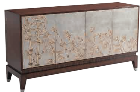
サイドボード(M6105-437) W173xD48xH92cm 885,600円