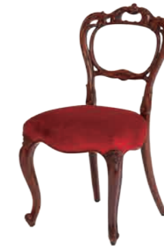
バルーンバックチェア(M4000-565R) W47xD50xH86cm 125,280円