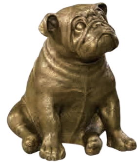
パグ(M1023-134) W24xD31xH30cm 56,160円