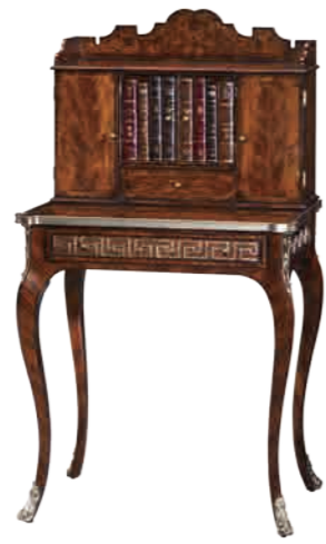
レディースデスク(M6100-199) W71xD46xH126cm 475,200円