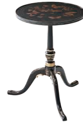
オケーショナルテーブル(M5002-178) W56xD49xH67cm 127,440円