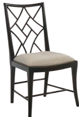
サイドチェア(M4000-844) W57xD58.5xH100cm 97,200円