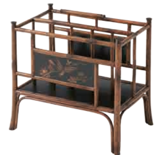
マガジンラック(NS1108-002) W48xD33xH49cm 60,480円