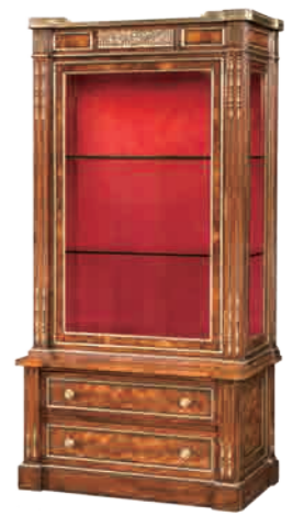
ディスプレイキャビネット(AL61017) W90xD49xH174cm 1,512,000円