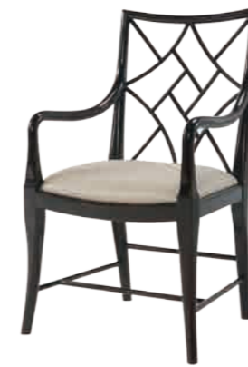
アームチェア(M4100-844) W60xD60xH100cm 108,000円