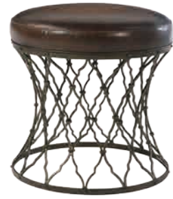
スツール(M4412-003) W47xD47xH46.5cm 151,200円