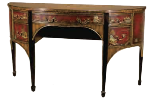
サイドボード(5130-373) W162.5xD56xH96.5cm 453,600円