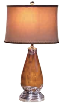
ランプ(M2005-048) W38xD23xH67cm 129,600円