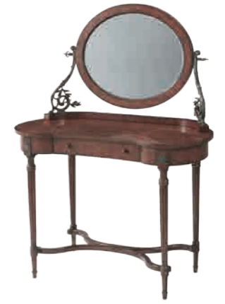
ドレッシングテーブル(M6105-047) W100xD54xH134cm 477,360円