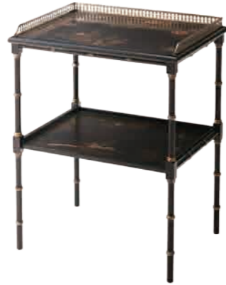
オケーショナルテーブル(M5002-236) W53.5xD40.5xH70cm 151,200円