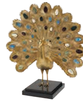
ピーコック(1054-284) W48xD48xH53cm 345,600円