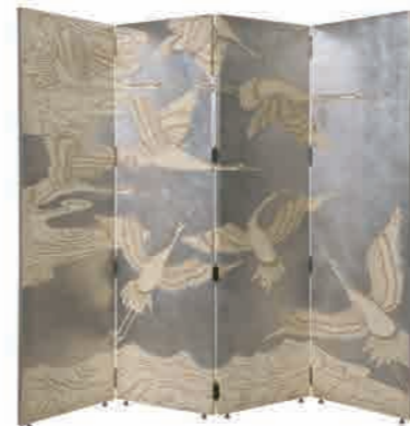
4Pスクリーン(M3202-348) W244xD3xH206cm 786,240円