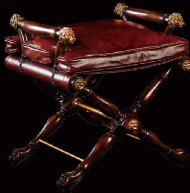
M4400-180DC W66.5×D54.5×H66.5cm / ¥506,000(税込)

ライオンモチーフのスツール。Xレッグのフレームと持ち手部分には、2種類、計10個の真鍮製ライオンヘッドが配されています。ライオンは強さ、勇敢さ、高貴さの象徴として17世紀以降、様々なスタイルの家具に好まれ使用されてきました。意匠に込められた思いやメッセージを読み取ることができるのも、クラシックスタイルの家具の魅力の一つです。