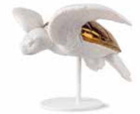
<リヤドロ> A09596 ウミガメ I (White-Copper) W24XD33XH19 cm / ¥116,600