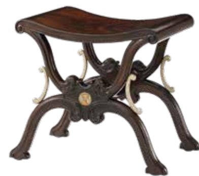
〈西村貿易〉 AL44001 スツール W60XD39XH50 cm / ¥253,000

イギリス スペンサー伯爵家所縁の名品をリプロダクトしたコレクション「オルソープ」のスツール。オリジナルは、伯爵家のライブラリーで現在も愛用されており、1730年頃にロバート・ギロウがランカスターで設立した家具工房 ギロウ社が手掛けたものと伝えられています。X型のフレームの中央にはスペンサー伯爵家の紋章が描かれています。