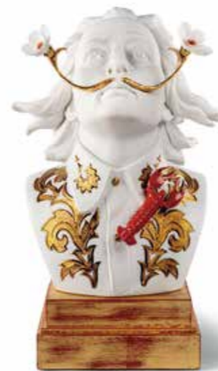
〈リヤドロ〉 A02030 ダリ W28XD23XH42 cm / ¥385,000

20世紀で最もユニークで天才アーティストであるサルバドール・ダリ。この壮大な作品は、高揚感と個性あふれる彼の姿を描いています。特徴的な口ひげと、ダリがこよなく愛した水仙の花を描き、さらにロブスターなどダリの作品の要素が加えられています。最もカリスマ的で現代において再現不可能な存在であるダリへのオマージュです。