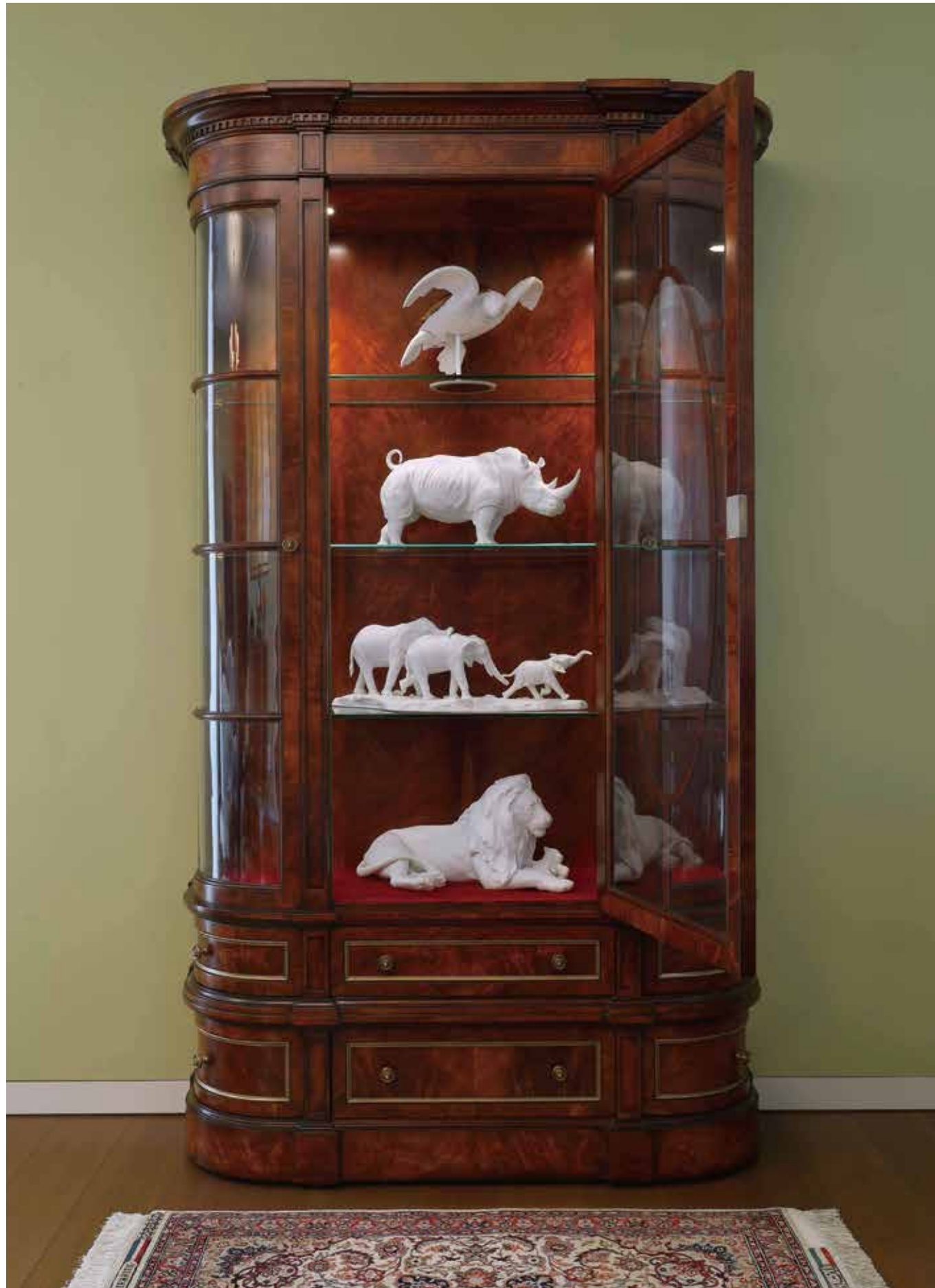
<西村貿易> ■ディスプレイキャビネット W118 x D40 x H193cm ¥1,837,000 <ライオンラグス> ■ペルシャ絨毯 イスファハン (B.セイラフィアン) 約106 x 71cm ¥2,750,000