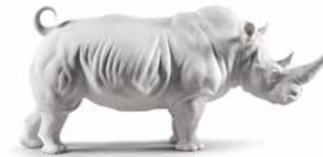
<リヤドロ> A09116 シロサイ (White) W43XD14XH20 cm / ¥122,100