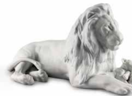
<リヤドロ> A09454 ライオンの親子 W44XD23XH21 cm / ¥127,600