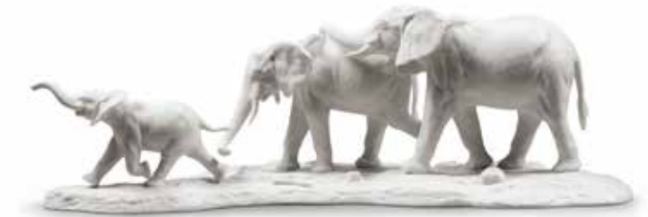
<リヤドロ> A09540 ついて行くよ (White) W49XD22XH18 cm / ¥267,300