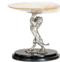
<西村貿易> HD1003 シェルディッシュ (ライオン) W16XD14XH13 cm / ¥44,000