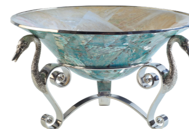
〈西村貿易〉 HD1006 センターピース (スワン) W32.5XD32.5XH17.5 cm / ¥165,000

選び抜いたシェルを内外に丁寧に張り込んだクラフトマンシップを感じるスワンのセンターピース。テーブル上のアクセントとしてクラス感のあるしつらえを演出します。