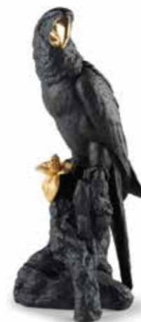
〈リヤドロ〉 A09577 コンゴウインコ (Bold Black) W22XD20XH47 cm / ¥169,400 シックなブラックに施された華やかなゴールドが目を引きBold Blackコレクション。ニュートラルかつ個性的なコンゴウインコです。