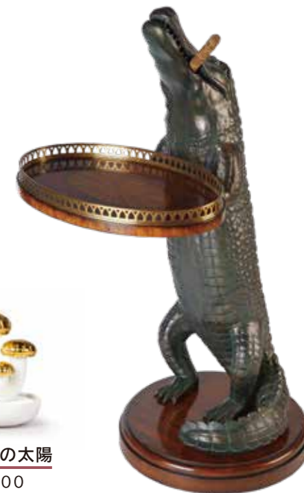
〈西村貿易〉 3020-056 ワニテーブル W49XD55XH93 cm / ¥264,000

メートランドスミス社製のサイドテーブル。葉巻を咥えながらサービングトレイを持つユニークな様子は住まう方はもちろんお迎えする方を和ませるシグネチャーピースです。