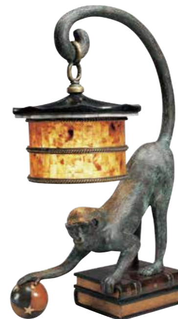
〈西村貿易〉 1753-570 モンキーランプ W41XD28XH63.5 cm / ¥319,000 アメリカ メートランドスミス社の代表作の一つのモンキーランプ。レザー製のブックの上でモンキーが尾でシェルのランタンを支えています。造形的にもユニークなランプは生み出す光や陰影はもちろん、オブジェとしても楽しめます。