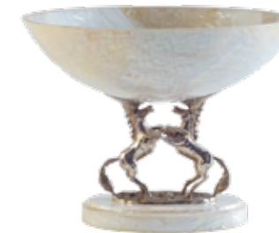
<西村貿易> HD1002 センターピース (ホース) W26.5XD26.5XH20.5 cm / ¥132,000