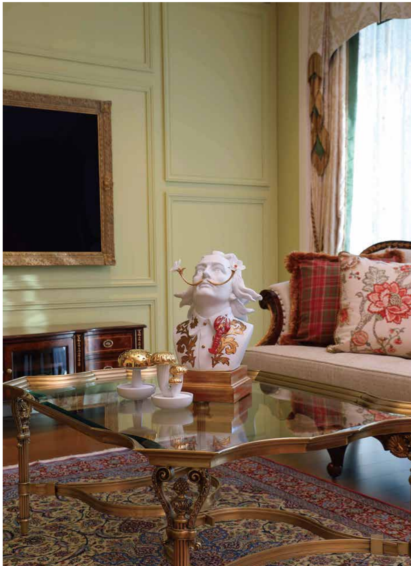
〈西村貿易〉 ■TVボード W173 x D51 x H51 cm ¥660,000 ■カクテルテーブル W120 x D83 x H49 cm ¥935,000 〈ライオンラグス〉 ■ペルシャ絨毯 イスファハン(ハギギ工房)約258 x 170 cm