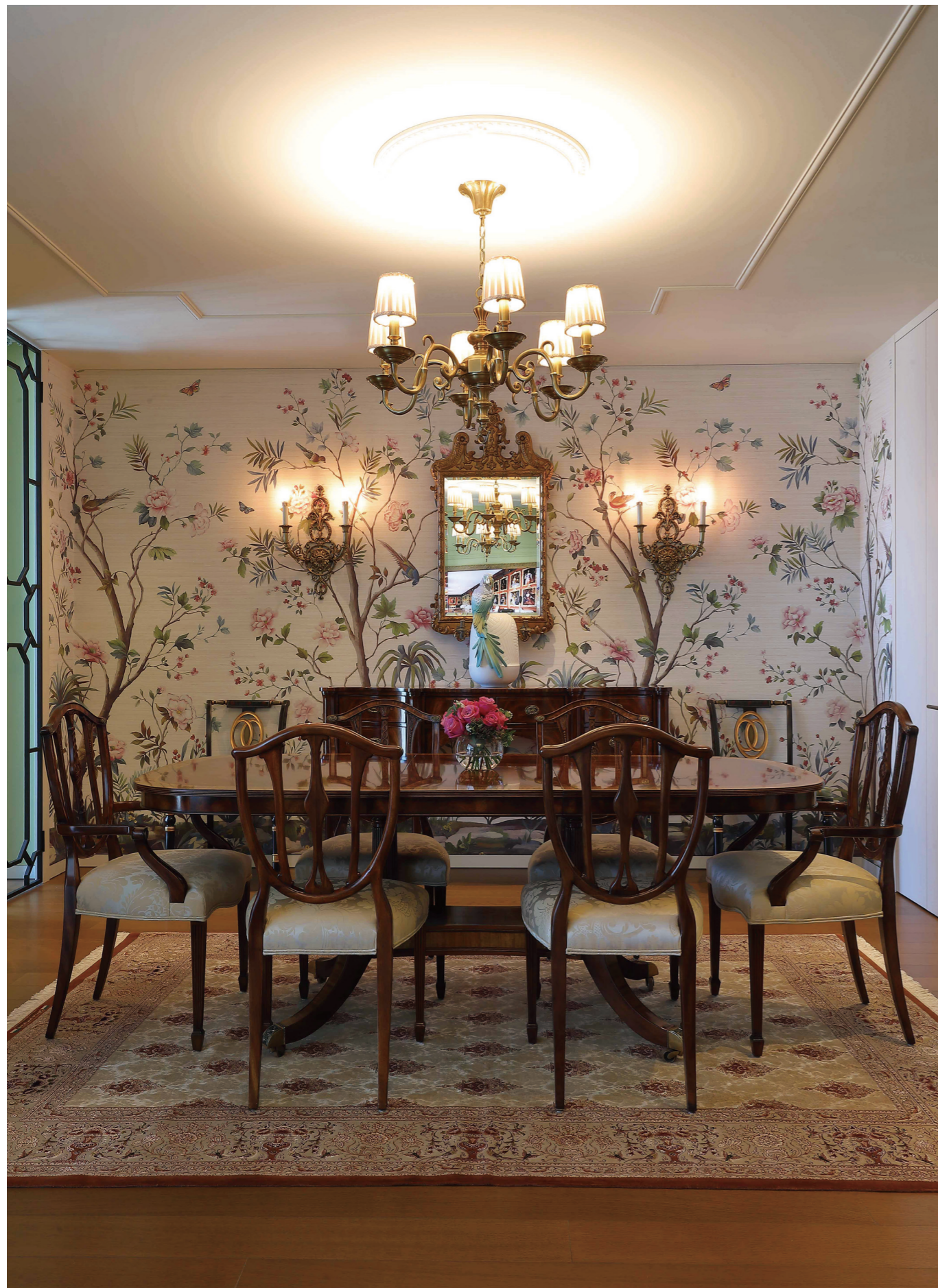
〈西村貿易〉 ■サイドボード W173 x D45 x H95cm ¥1,001,000 ■ミラー W62 x D18 x H122 cm ■ダイニングテーブルセット(テーブル x 1、アームチェア x 2、サイドチェア x 4) ¥3,137,200 (ダイニングテーブル W154~200 x D100 x H75cm ¥1,485,000、アームチェア W60 x D55 x H97cm 1脚 ¥289,300 サイドチェア W49.5 x D55 x H95cm 1脚 ¥268,400)