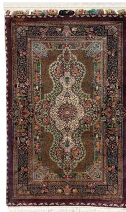
〈ライオンラグス〉 SA10481E クム (M. ジャムシディ工房) シルク 約125X78 cm / ¥3,300,000 キングオブペルシャと呼ばれるM.ジャムシディ工房。複雑で緻密な色彩、斬新なデザインの中に、イランの文化、歴史的建造物などをモチーフとして取り入れた独自の世界観が存在しています。天然の絹糸、高技術の草木染、上質なマテリアルを追求し、織り上げられた作品は他に類を見ない逸品です。当作品は、王冠や歴史的建造物などのイランの歴史や文化をモチーフとした文様や、様々な動植物が織り込まれたペルシャ文明の繁栄が描かれており、絨毯の伝統文様と融合した秀逸な作品です。

イギリス スペンサー伯爵家所縁の名品をリプロダクトしたコレクション「オルソープ」のスツール。オリジナルは、伯爵家のライブラリーで現在も愛用されており、1730年頃にロバート・ギロウがランカスターで設立した家具工房 ギロウ社が手掛けたものと伝えられています。X型のフレームの中央にはスペンサー伯爵家の紋章が描かれています。