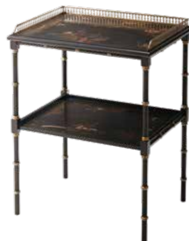
〈西村貿易〉 M5002-236 シノワズリテーブル W53.3XD40.6XH69.5 cm / ¥181,500